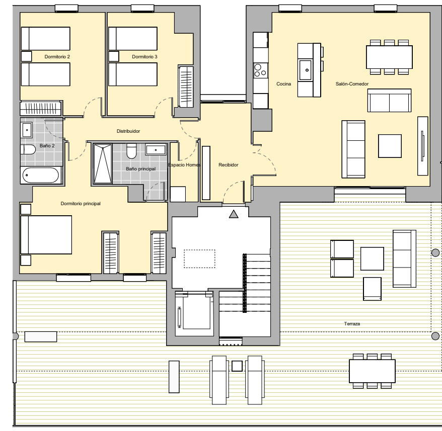
3 DORMITORIOS BLOQUE 7 PORTAL 1 PLANTA ALTA PUERTA A